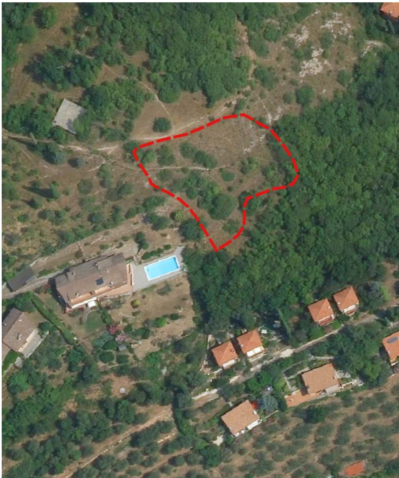
ORTOFOTO CON SOVRAPPOSIZIONE AREA PERCORSO DAL FUOCO

SCHEDA N° 10 - ID 01/2021 - Località ORIOLO - Data incendio 17/03/2021