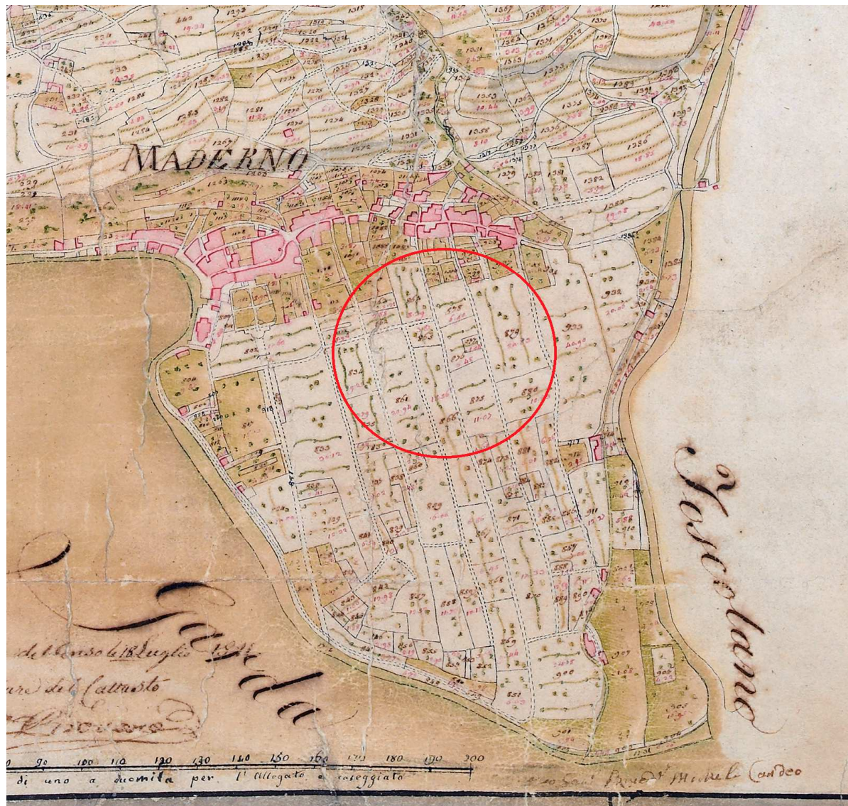
Mappa Catasto Napoleonico Maderno

La parte dell'ampliamento è realizzata a partire dal 1978, come più oltre descritto.