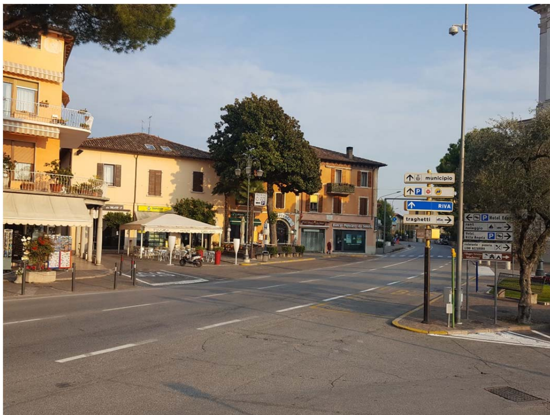
Fotografia pos. 1