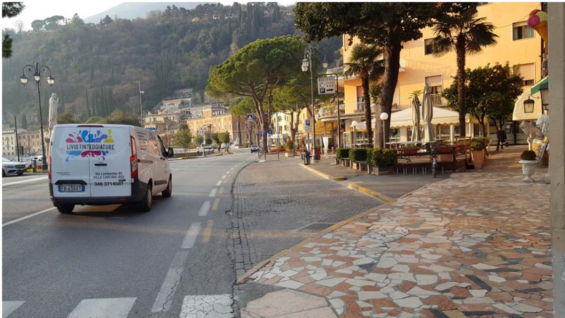
Fotografia pos. 3