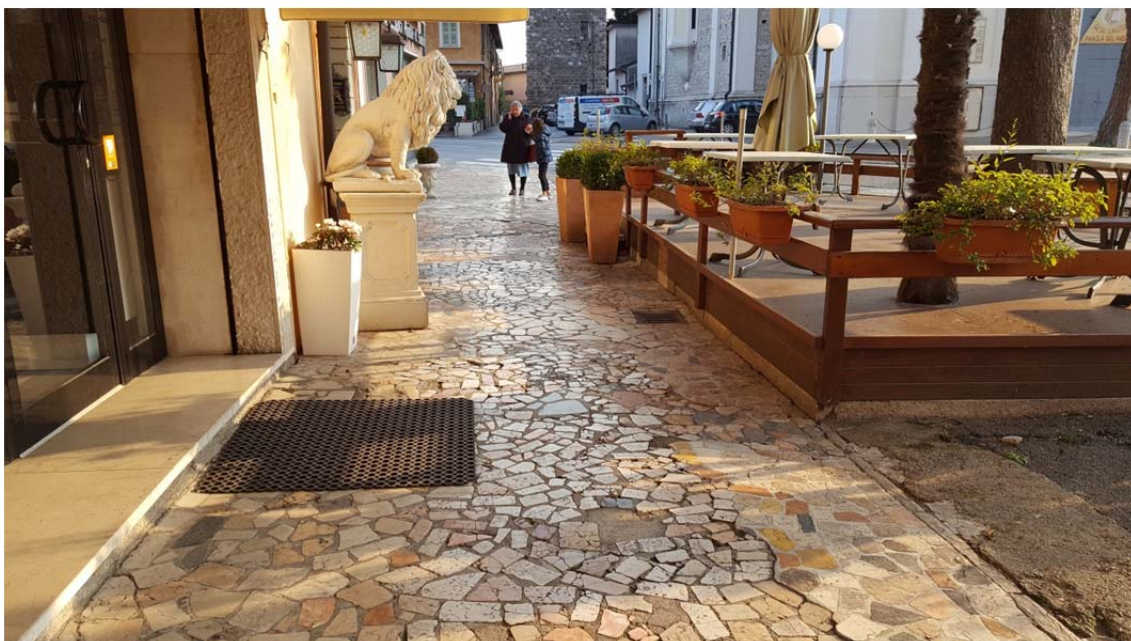
Fotografia pos. 5