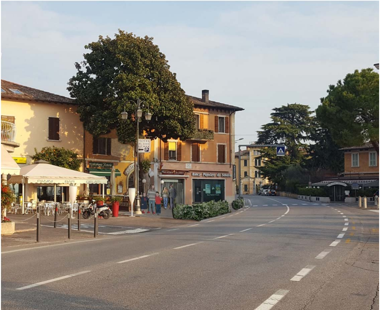
Simulazione fotografica pos. 1