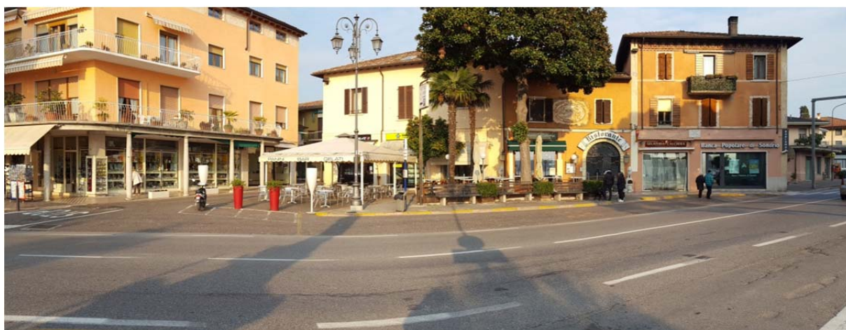
Fotografia pos. 2