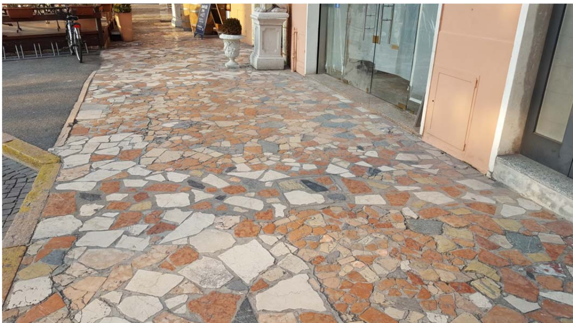
Fotografia pos. 4