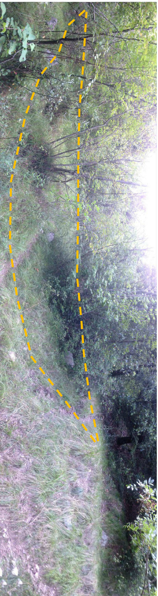
FOTO 5 Scatto panoramico dal centro dell'avvallamento naturale individuato per il deposito materiale