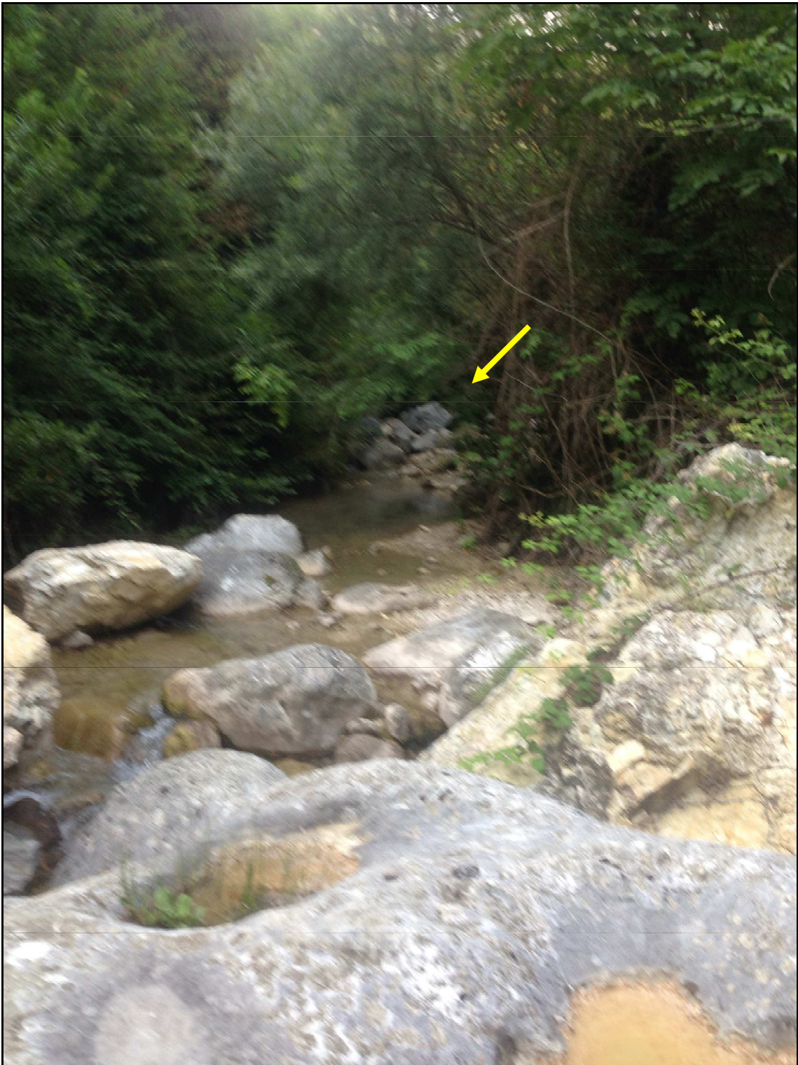
FOTO 4 – Scatto dal centro di alveo, sullo sfondo il punto di arrivo dei mezzi per lo scarico del materiale