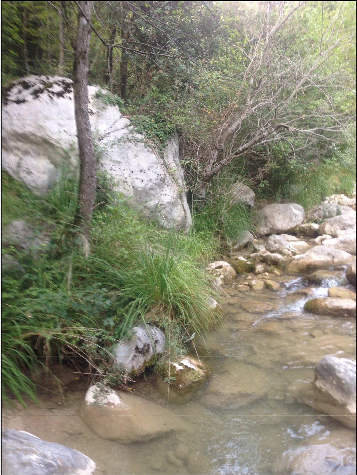
FOTO 2 – Foto in prossimità del masso antistante l'area di deposito