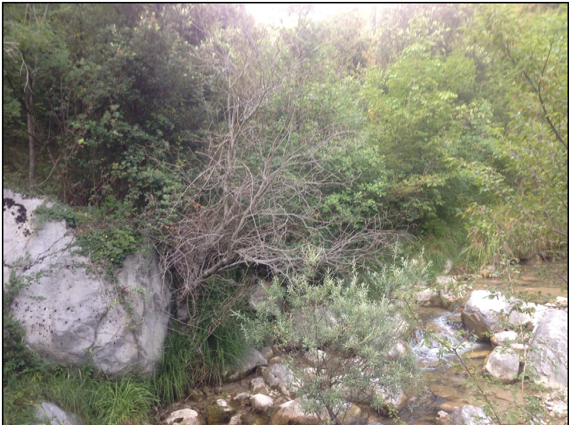
FOTO 1 – Scatto in prossimità dell'area di deposito che si trova dietro l'argine o sponda idrografica dx