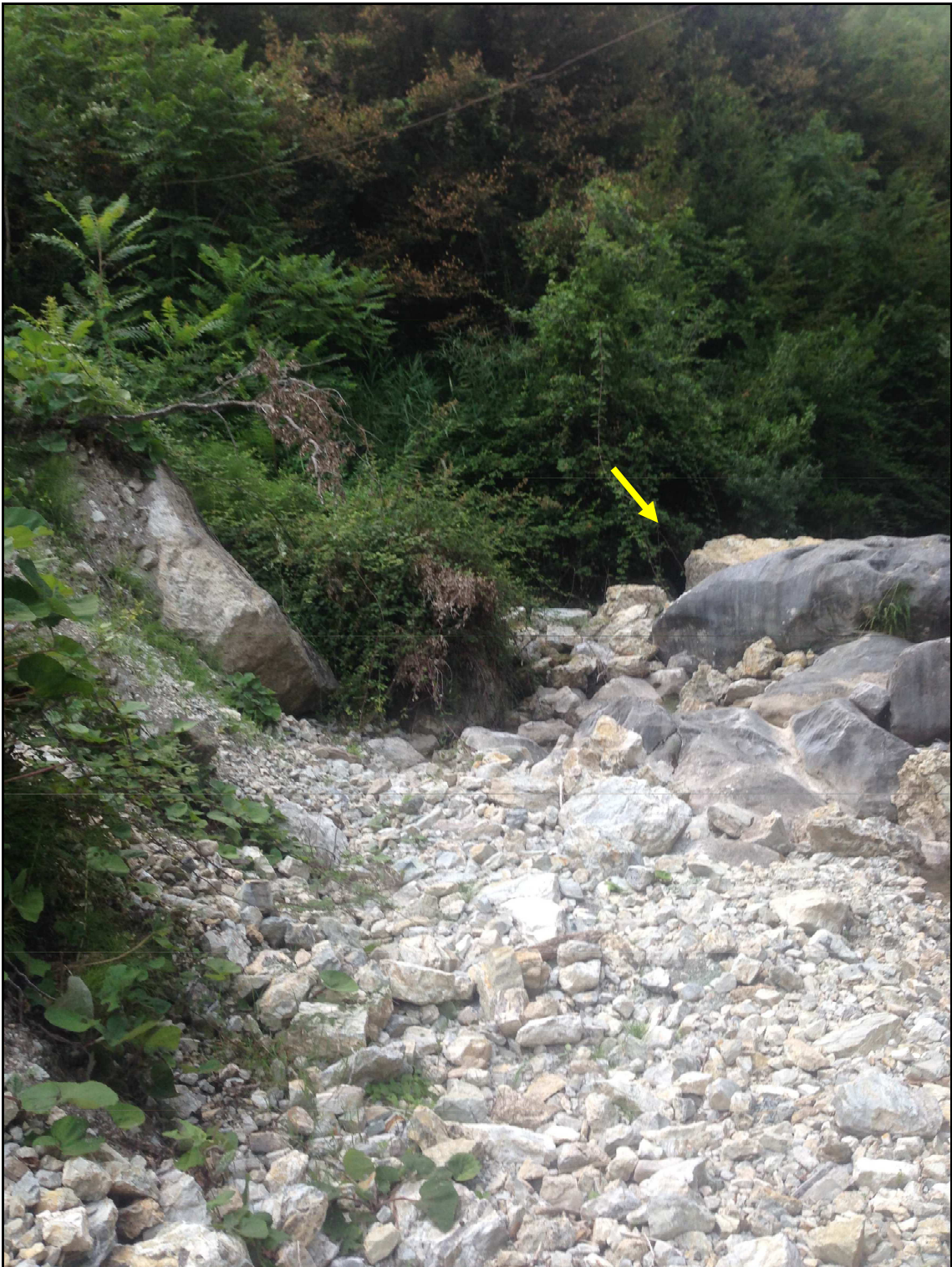
FOTO 3 – tratto di alveo sottostante la frana con materiale da rimuovere e trasportare. In evidenza sullo sfondo il salto di quota.