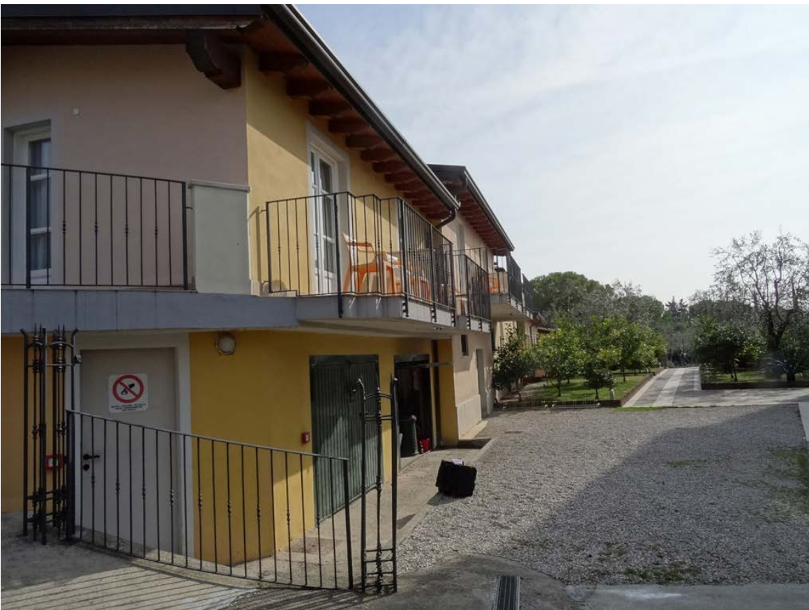
Prospetto sud-ovest stato di fatto