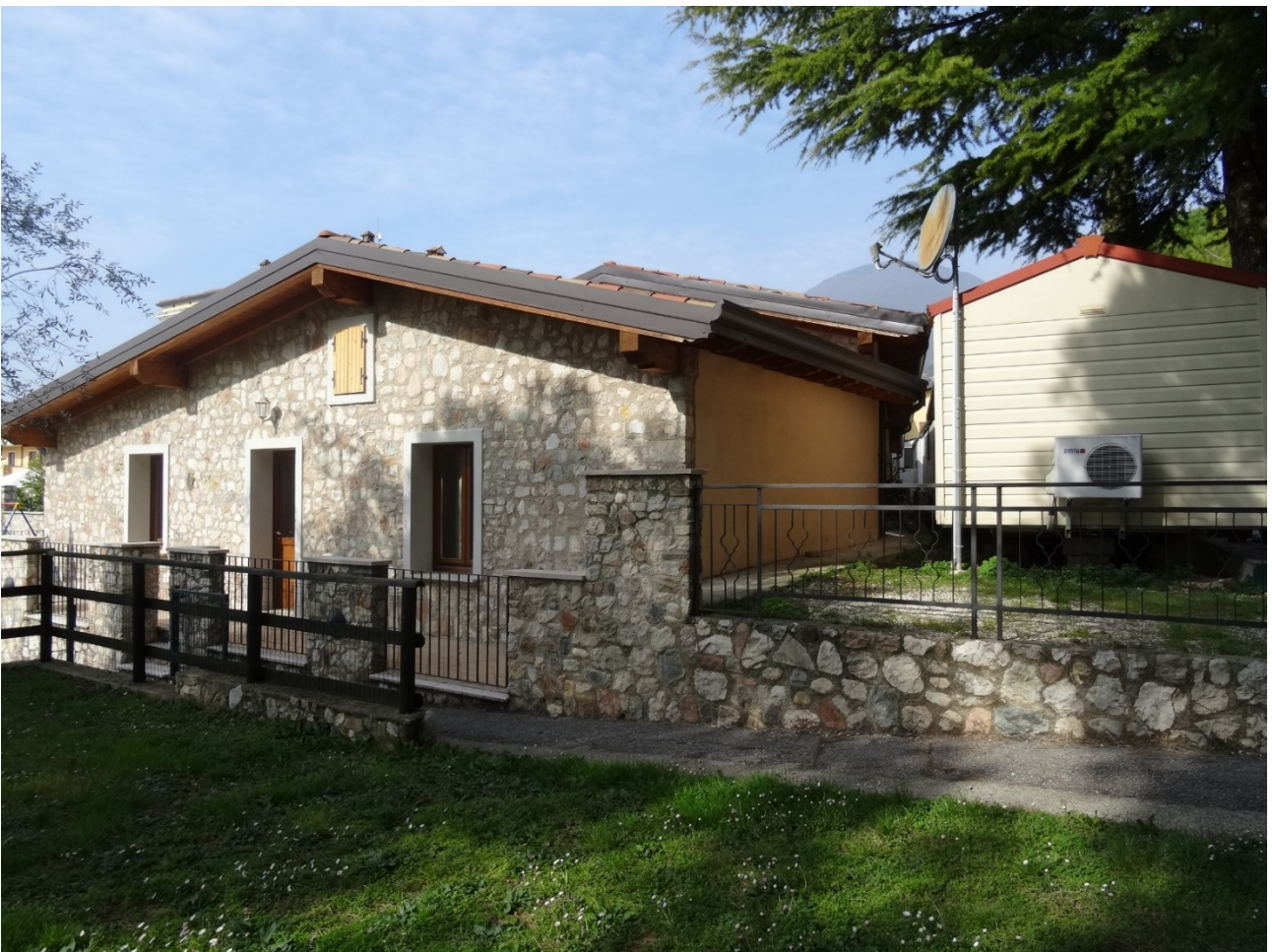
Prospetto Est stato di fatto