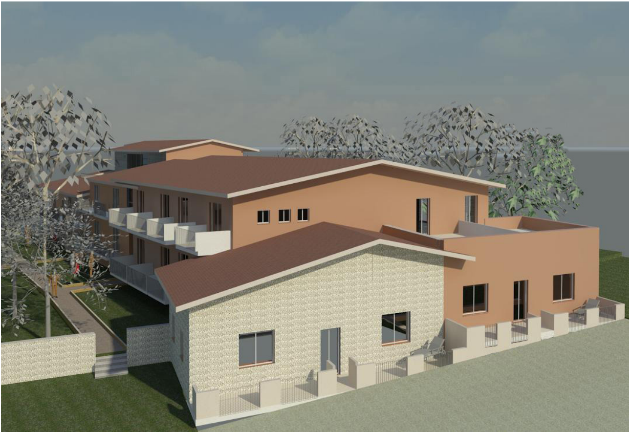
Prospetto Est di progetto