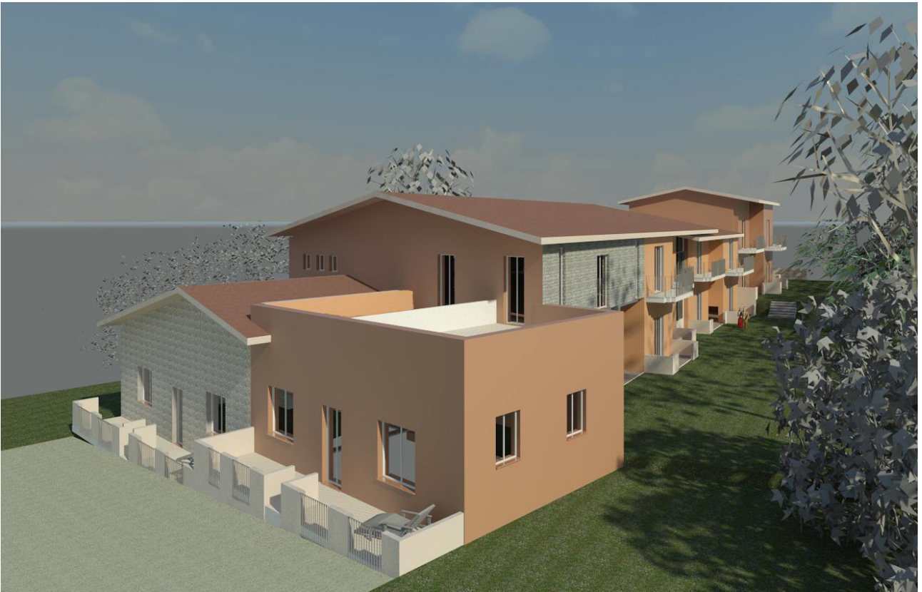
Prospetto nord-est di progetto