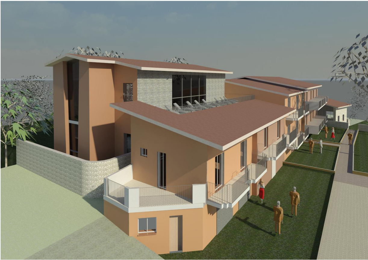
Prospetto sud-ovest di progetto