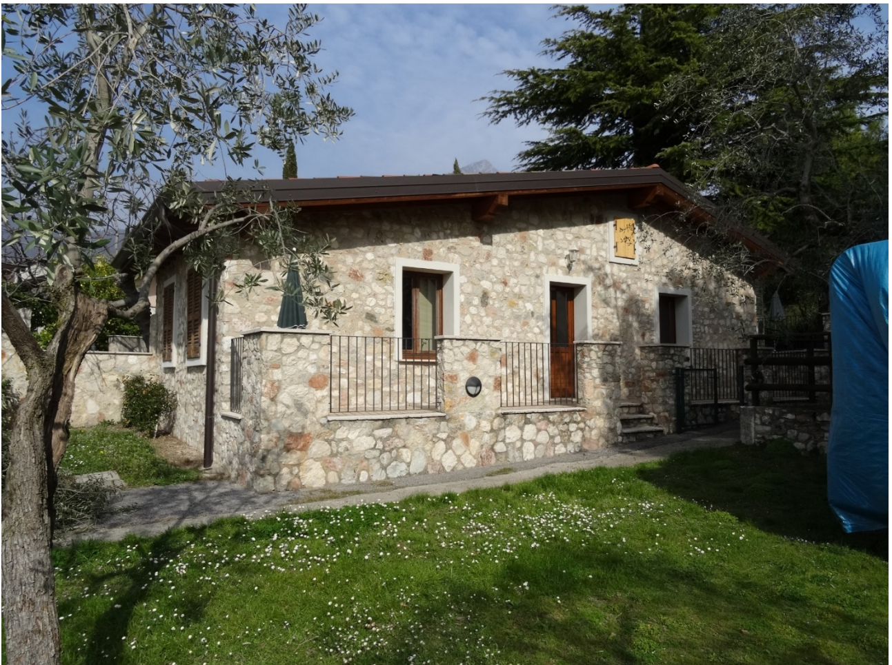
Prospetto Est stato di fatto