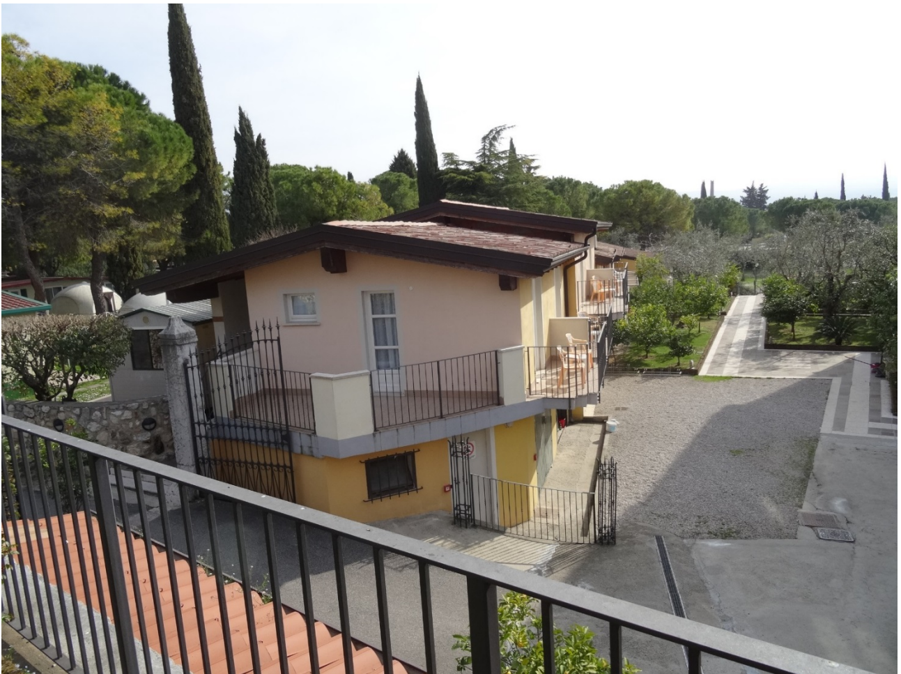
Prospetto sud-ovest stato di fatto