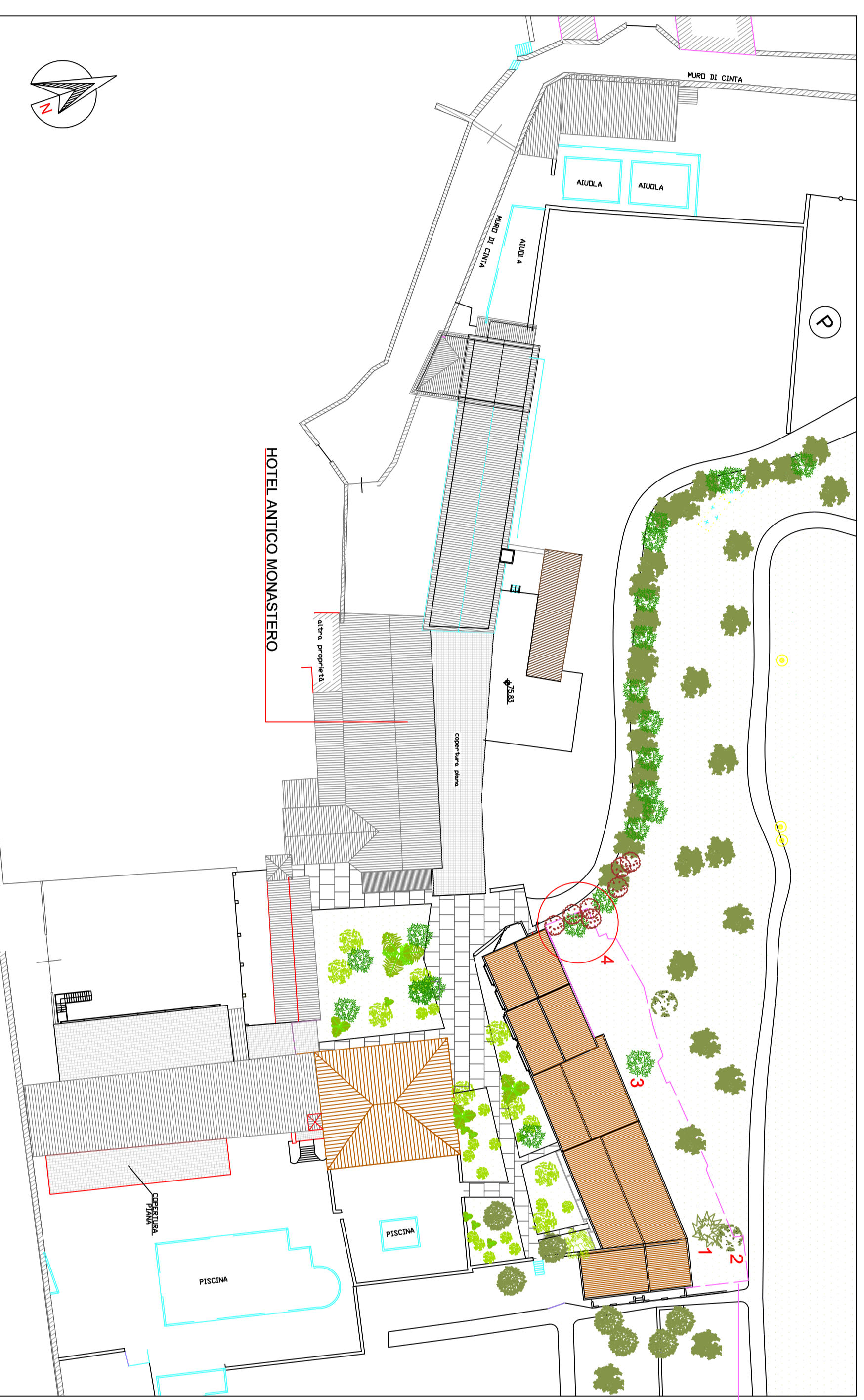
Planimetria generale - Stato di fatto